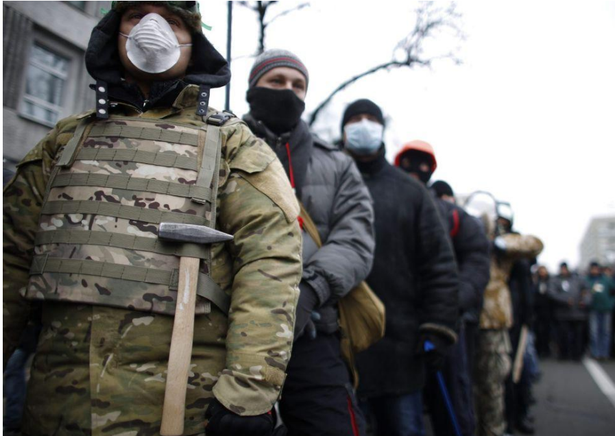
Foto 6: "Manifestantes dotados de mascarillas contra el uso de gases lacrimógenos por la policía, en el centro de Kiev". (3)

Y eso que nos decían que la policía había usado gases lacrimógenos, igual han aprendido de los manifestantes. Otra vez más, tal acto aquí, en occidente, tendría un castigo de muchísimos años de cárcel y tendríamos a todos los medios de comunicación denunciando y acusando a los "terroristas organizados". Ha ocurrido en Ucrania y contra un gobierno que no obedece las indicaciones del mundo corporativo occidental y, por tanto, no lo califican así. Así, la culpa finalmente es del gobierno y la violencia parece incluso aceptable. Tenemos una vez más al cinismo mediático trabajando a toda máquina.