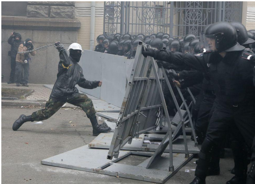
Foto 3: "un manifestante se abalanza contra los policía antidisturbios portando una cadena" (3)

Vuelvan a hacerse la misma pregunta, ¿qué castigo tendría este acto en España o en Estados Unidos?