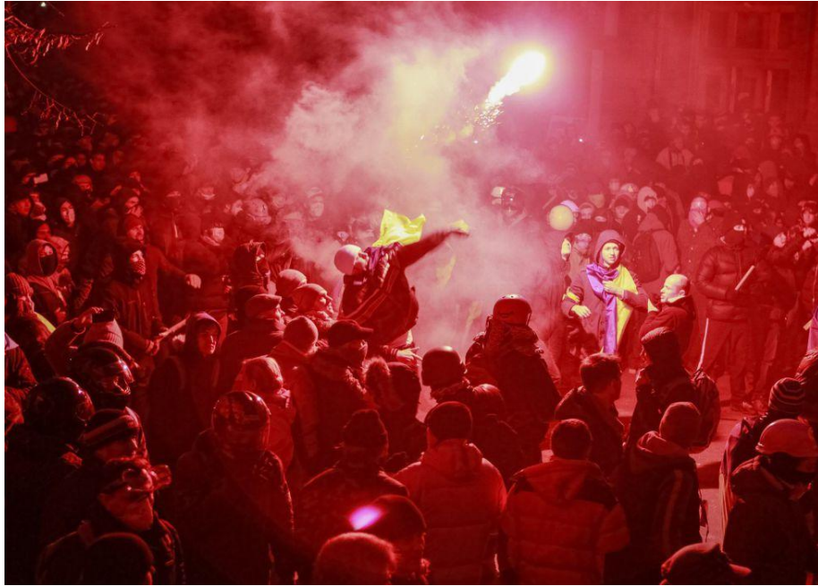
Foto 2: "un manifestante lanza una bengala contra la sede del ministerio del interior" 3 (en minúscula lo del Ministerio porque no es amigo)

Vuelvan a hacerse la misma pregunta, ¿qué castigo tendría este acto en España o en Estados Unidos?