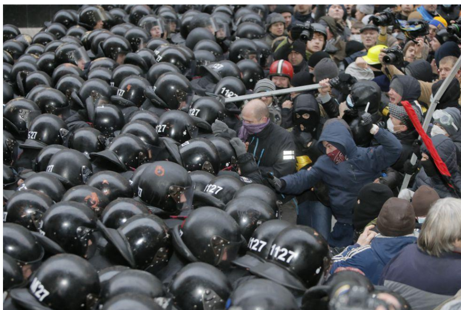
Foto 4: "los opositores logran traspasar las barreras que las fuerzas de seguridad habían levantado en el centro de la ciudad" (3)

La foto 3 vuelve a ser elocuente del grado de violencia empleado por los manifestantes. Aquí agreden brutalmente con cadenas, mientras la policía permanece inmóvil protegiéndose con las vallas protectoras.