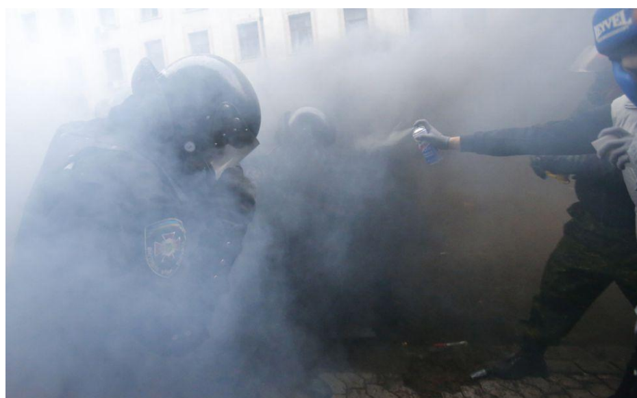
Foto 5: "Muchos de los manifestantes usando gas lacrimógeno contra la policía". (3)

En realidad, los "opositores" están agrediendo con extrema violencia a la policía utilizando barras de hierro. El País igual no quiere percatarse de ello, aunque sea completamente evidente. Qué diferente versión y titulares tendríamos si esto ocurriese aquí o en un lugar donde este periódico tuviese que defender los intereses económicos de sus dueños, de las corporaciones occidentales.